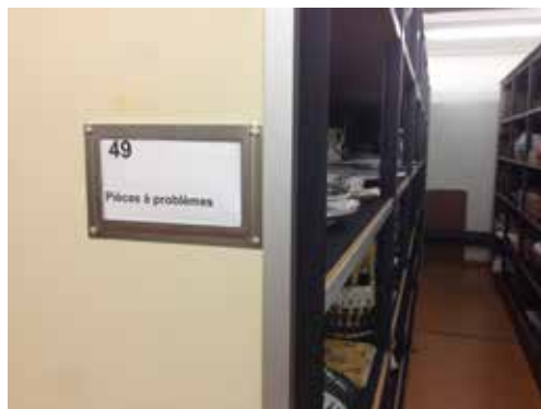
| Foto aus dem Depot des Musée Ariana