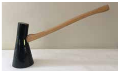
Richard Slee (1946) Angle Axe , 2019 Gegossene Fayence, Email, Holz / Maiolica modellata, smalto, legno H. 44 cm; L. 76 cm