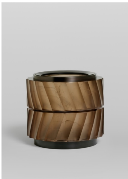
01 Anna Dickinson Vessel , 2014 Verre moulé, taillé et poli, acier oxydé Haut. 21 cm x Larg. 22,5 cm Collection privée