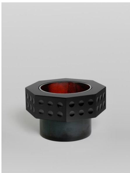
02 Anna Dickinson Vessel , 2013 Verre moulé, taillé et poli, acier ciré Haut. 15 cm x Larg. 24 cm Propriété de l'artiste