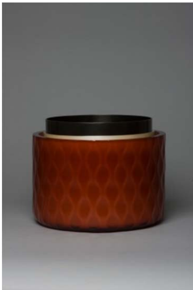
Anna Dickinson Vessel , 2009 Verre moulé, taillé et poli, acier et argent Haut. 23 cm x Larg. 28.5 cm Collection privée