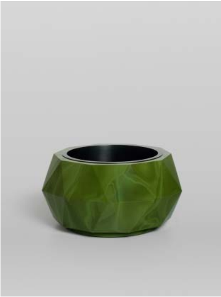
03 Anna Dickinson Vessel , 2014 Verre moulé, meulé et poli, cuivre oxydé Haut. 13 cm x Larg. 26,5 cm Collection privée