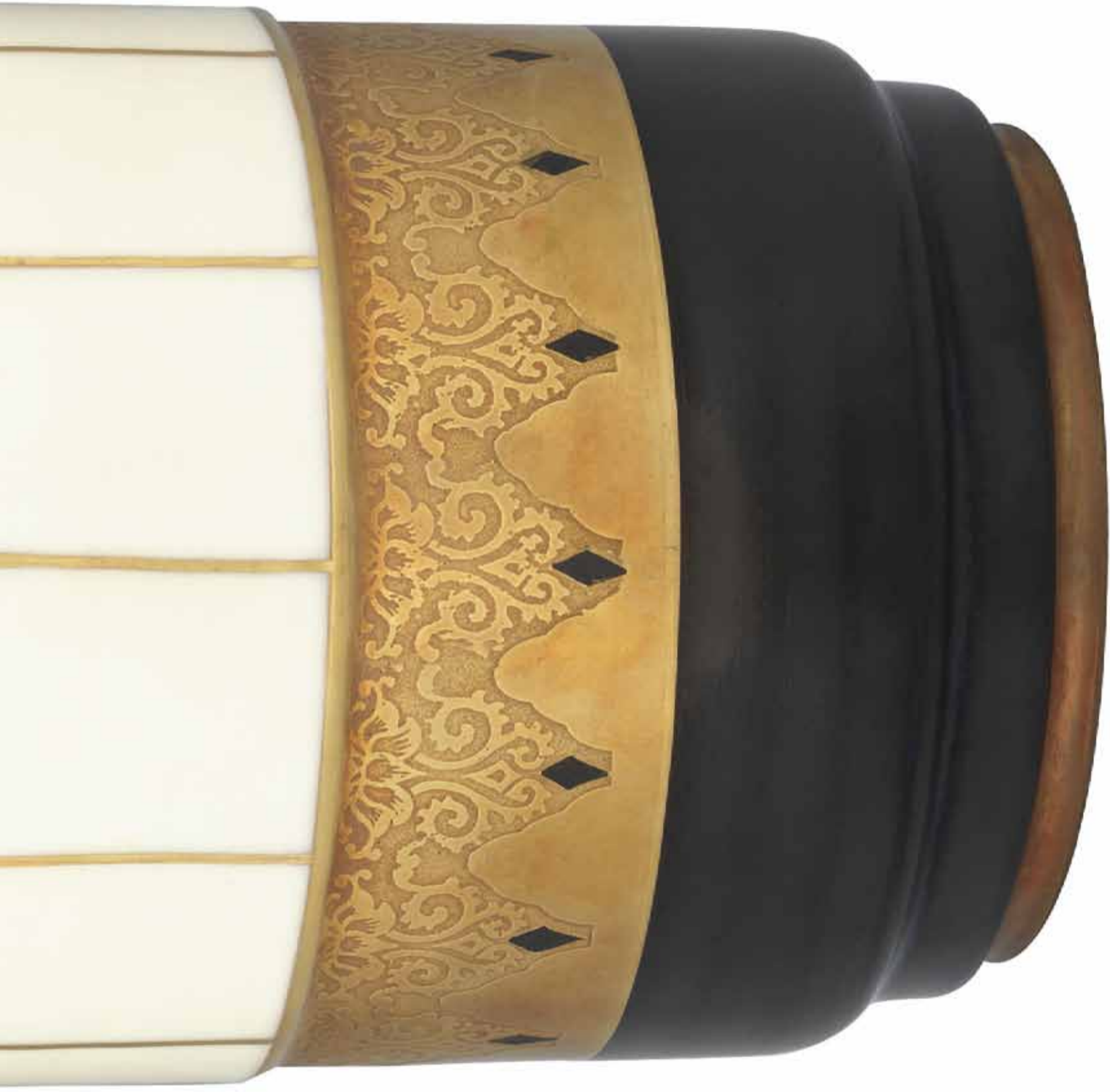
Vase, 1928? Porcelaine de Langenthal Fond d'émail jaune pâle et noir, décor à l'or gravé à l'acide H 28 cm Collection Musée Ariana