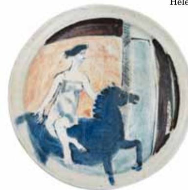
Coupe, 1927 Porcelaine de Langenthal Décor peint aux émaux polychromes et à l'or D 24.5 cm Collection Musée Ariana