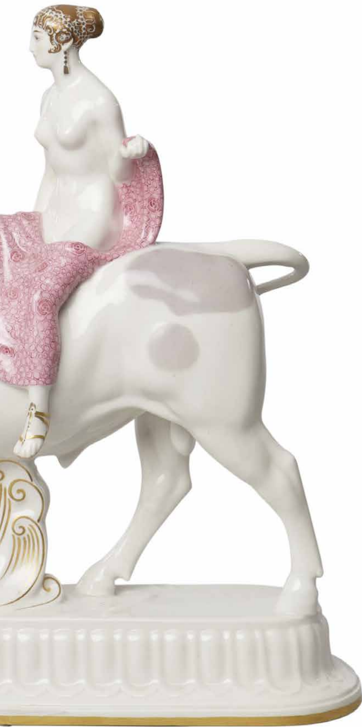
La future mariée, 1923 Manufacture royale de Berlin (KPM) modèle de Adolph Amberg porcelaine, émaux polychromes et or L. 42,5 cm collection Musée Ariana