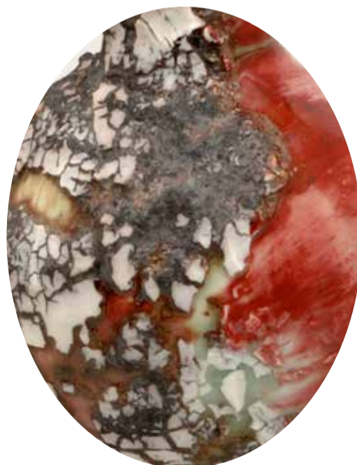
Gareth Mason Vase, Red Aqua, 2008 (détail) porcelaine, émaux, concrétions h. 32 cm collection Musée Ariana

Cet atelier pour adultes aura lieu le dimanche 10 mai de 10 h à 13 h. Sur inscription, 10 personnes maximum. Prix : 60 CHF