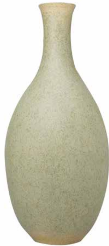
José Llorens Artigas Vase, vers 1960 grès porcelaineux, émail mat h. 41 cm collection Musée Ariana