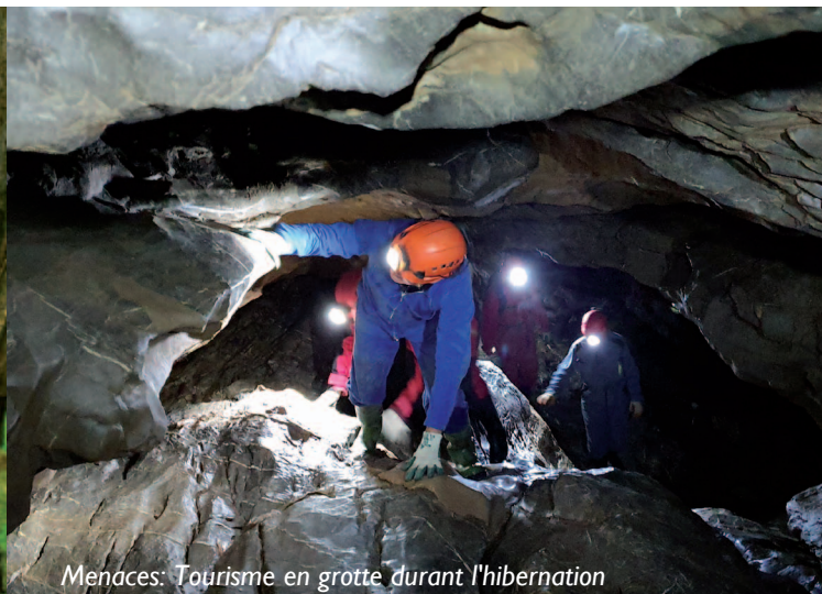
Menaces: Tourisme en grotte durant l'hibernation