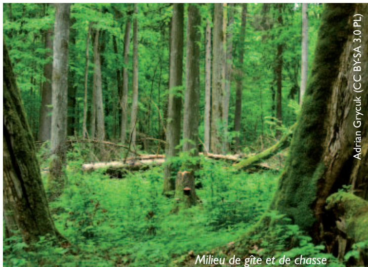
Milieu de gîte et de chasse

Recenser, inclure dans l'aménagement du territoire et protéger systématiquement les couloirs de vol nocturnes entre les gîtes et les terrains de chasse. Contrôler et, si nécessaire, optimiser l'éclairage et les corridors structurels à proximité des gîtes. Créer des synergies avec d'autres espèces cibles afin d'établir une infrastructure écologique favorable à travers les zones d'habitation (en particulier les corridors sombres).