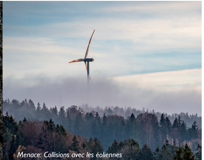
Menace: Collisions avec les éoliennes