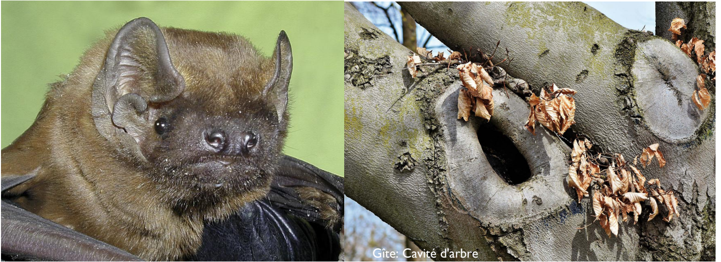
Gîte: Cavité d'arbre

Synergies : Noctule de Leisler, Noctule commune, Vespertilion bicolore, Pipistrelle de Nathusius