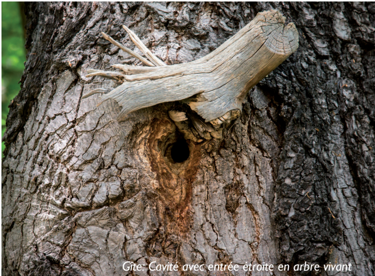
Gîte: Cavité avec entrée étroite en arbre vivant

Protection des couloirs de migration au niveau interrégional et international. Prendre en compte ces corridors dans les projets éoliens. Éviter l'empiétement sur les grands axes migratoires.