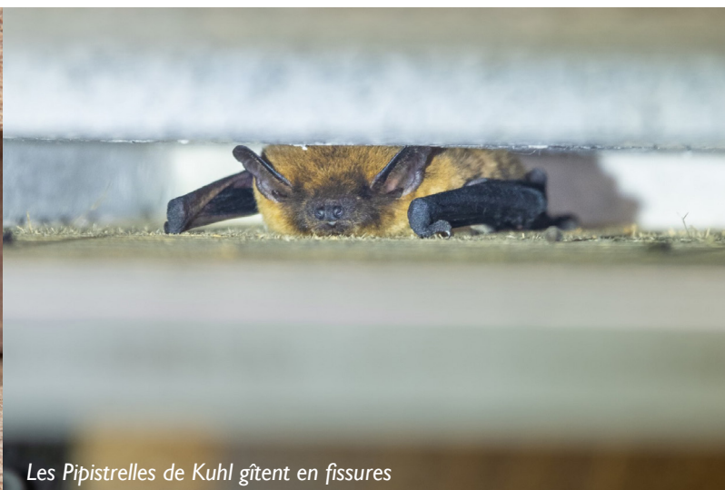
Les Pipistrelles de Kuhl gîtent en fissures