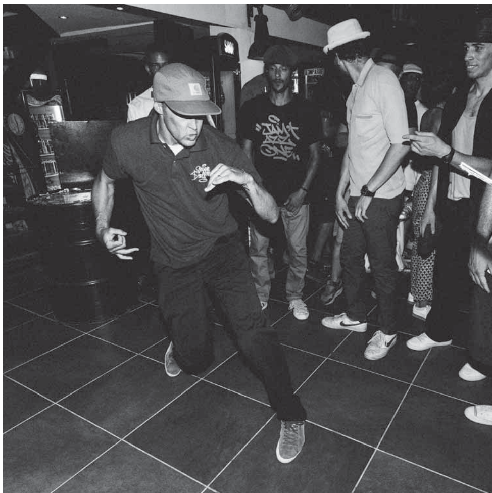
COUVERTURE: KALONJI, ODORU, 2020 4E DE COUVERTURE:

MUSÉE D'ART ET D'HISTOIRE RUE CHARLES-GALLAND 2 CH-1206 GENÈVE T +41 (0)22 418 26 00