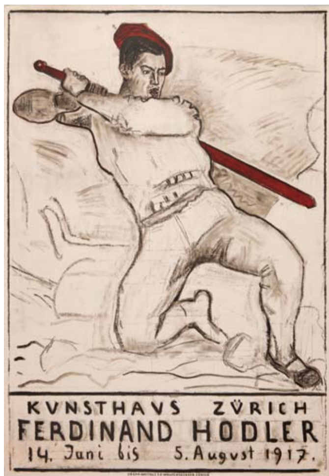
Affiche de l'exposition «Ferdinand Hodler» au Kunsthau Zürich, 1917 Lithographie en couleurs, 1325 x 912 mm CdAG, inv. E 2011-906