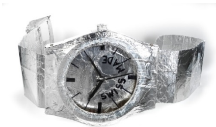
Thomas Hirschhorn (né en 1957) et Parkett Verlag , Zurich Swiss made , 1999 Carton recouvert d'aluminium, aiguilles en bois teinté en noir, baguette plastique et aluminium. Ex. n° 11/ 50

Comme en témoigne sa vaste pratique interdisciplinaire, Hirschhorn se sert de l'art pour interroger le monde et ses problèmes. À l'aide de matériaux ordinaires et universels (carton, ruban adhésif, plastique...), il crée des installations percutantes : « (...) il s'agit de montrer mon dégoût du discours dominant et de montrer mon mépris pour la fascination du pouvoir ». Swiss Made se fait à la fois objet de la critique de l'artiste pointée vers le complexe industriel mondialisé, et symbole du pouvoir d'attraction de la maîtrise du temps, ancrée dans le territoire helvétique.