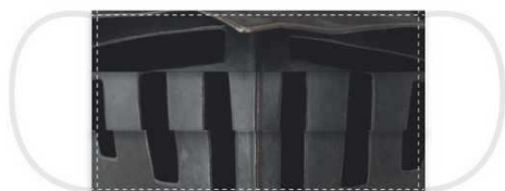
D'après un armet savoyard, v. 1600-1620 Inv. C 905