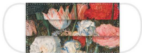
D'après Jan I Brueghel (1568-1625) Bouquet de fleurs dans un vase , v. 1610 Inv. 1990-33