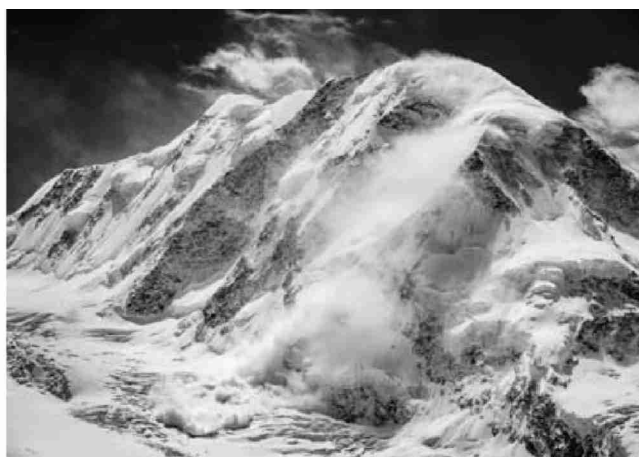
Le Lyskamm dans le massif du Mont-Rose en proie à une avalanche.