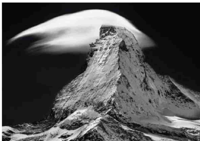
Le Cervin coiffé de son nuage de föhn.