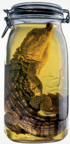
Crocodile, collection en alcool du MHNG