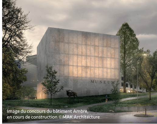
Image du concours du bâtiment Ambre, en cours de construction ©MAK Architecture

Le site fait sa transition énergétique avec une toiture végétalisée sur le bâtiment Ambre, l'installation d'une centrale photovoltaïque et d'un chauffage assuré à 45% par des énergies renouvelables (puis ultérieurement à 80%).