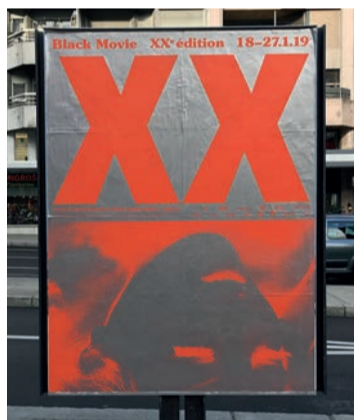
Neo Neo, 2019