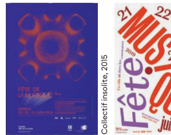
Collectif insolite, 2015

En lien avec cette conférence: Exposition « Quand la musique s'affiche » du 9 juin au 15 juillet 2021 à La Musicale, 1 er étage de la Maison des arts du Grütli.