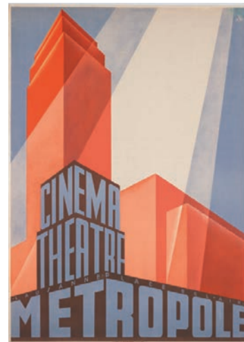
Musée historique de Lausanne, K. F. 1931