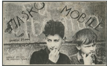
Archives contestataires, anonyme, sans date

En lien avec cette conférence: Exposition «Affiches sauvages, mémoires militantes» jusqu'au 4 septembre 2021 dans le Couloir des coups d'œil de la Bibliothèque de Genève, 1 er étage aux Bastions.