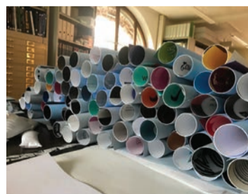
Bibliothèque de Genève, 2019

Nelly Cauliez Conseillère en conservation des collections, Ville de Genève Brigitte Grass Spécialiste scientifique, ancienne responsable de la collection d'affiches de la Bibliothèque de Genève Ou comment des rouleaux accumulés au grenier durant plus d'un siècle créent les fondements d'une des plus intéressantes et importantes collections suisses. Collecter, organiser, gérer, conserver et mettre en valeur 130 000 affiches : un quotidien fait de contingences matérielles, de restauration, de dépoussiérage, mais aussi de recherches, de rencontres, de colloques et... de Jeudis midi!