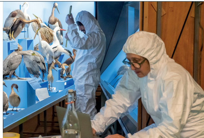
Inspection des spécimens

Le monitoring doit être réalisé régulièrement et sur une période suffisante pour fournir des résultats fiables sur le niveau d'infestation.